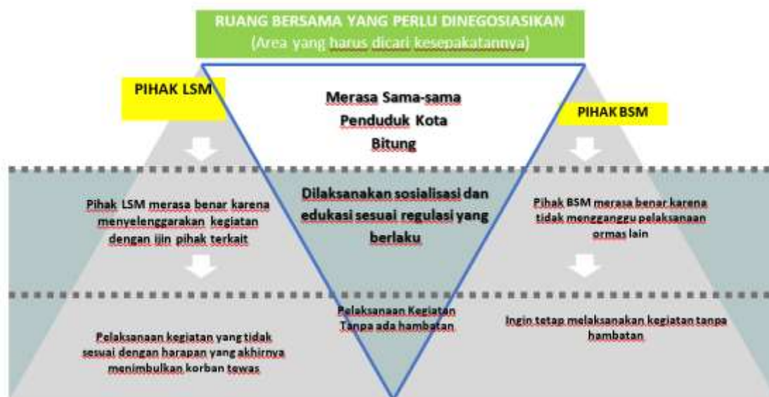
Gambar 3. Ruang Bersama