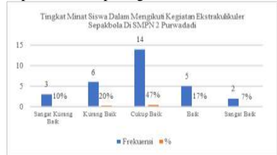
Gambar 1. Diagram hasil penelitian

Jika ditampilkan dalam bentuk diagram dapat kita lihat pada gambar dibawah ini: