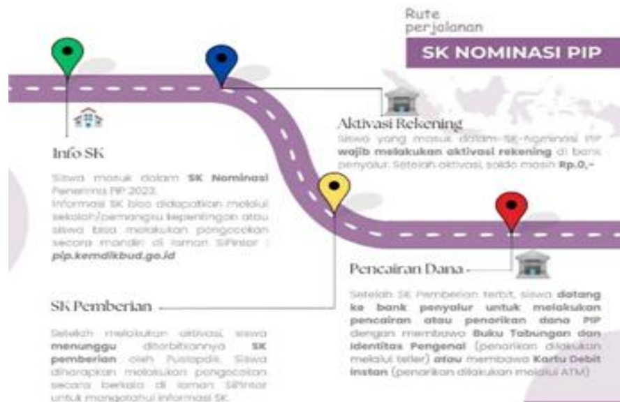
Gambar 2. Pihak Pelaksana PIP

Sumber daya manusia memiliki peran penting dalam pelaksanaan serta keberhasilan PIP. Berdasarkan hasil wawancara, observasi dan telah dokumen terkait program PIP, pihak pelaksana Program ini dimulai dari: