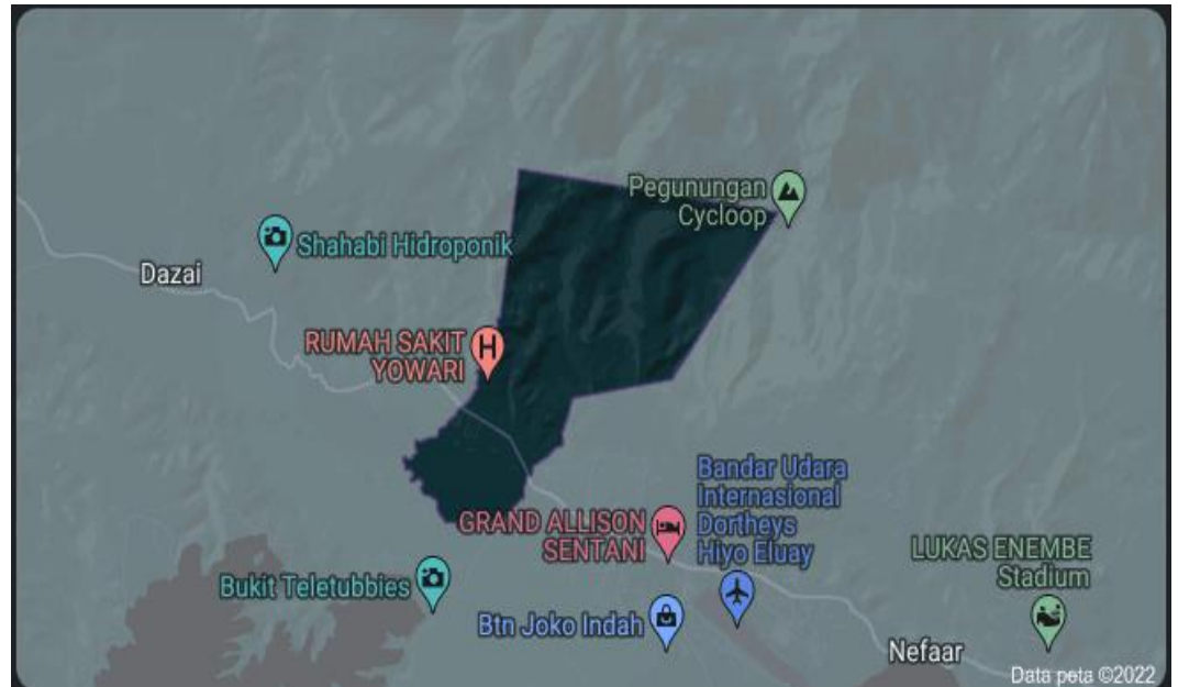
Gambar 1. Peta Administrasi Kampung Doyo Baru

Barat Kampung Bambar, Timur Kelurahan Hinikombe Kampung Doyo Baru terdiri dari 11 RW dan 53 RT.