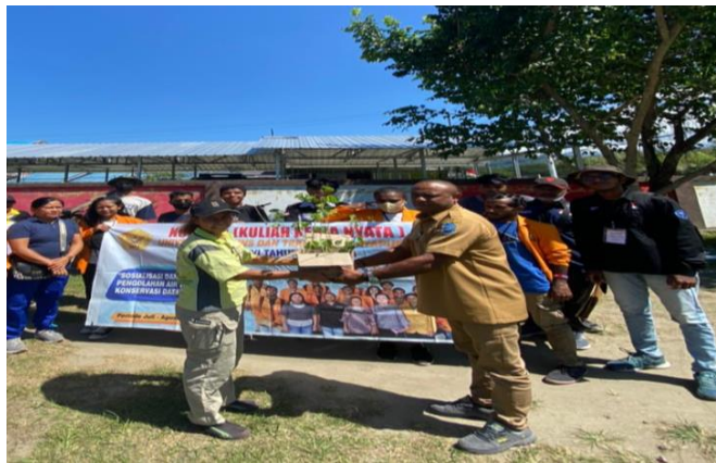
Foto 2. Penyerahan bibit tanaman trambesi bersama aparat kampung Doyo Baru

Dalam program ini kami melakukan penanaman pohon di aliran sungai Yowari di daerah konservasi Doyo Baru bersama masyarakat Kampung Doyo Baru. Program ini kami lakukan dengan maksud dan tujuan untuk meningkatkan kepedulian masyarakat akan pentingnya penanaman dan pemeliharaan pohon di sepanjang aliran sungai Kampung Doyo Baru. (Todd, 1980) Untuk mengurangi resiko banjir dan tanah longsor di daerah aliran sungai Kampung Doyo Baru. (Prabowo dkk, 2022)