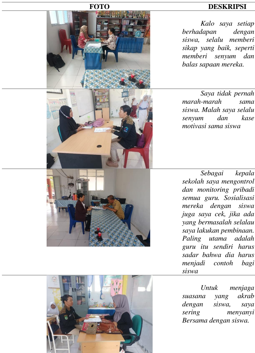
Tabel 1 Lembar Hasil Wawancara & Dokumentasi Tentang Kompetensi Kepribadian Guru

2) Bagaimana peran guru dalam memahami keberadaan mereka sebagai guru di SDN Unggulan 1 Morotai?