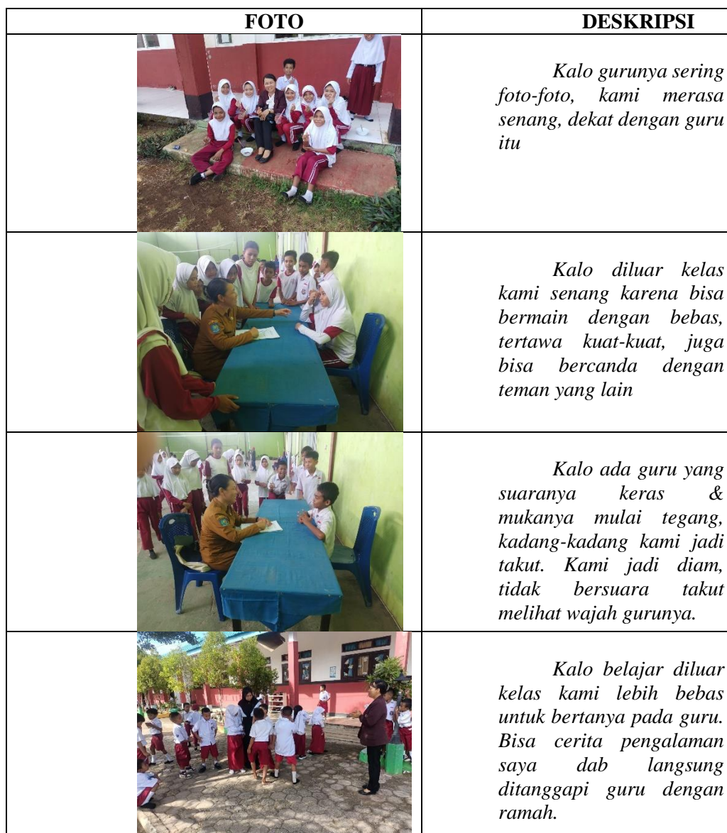
Tabel. 3 Lembar Dokumentasi Tentang Pembentukan Karakter Siswa

Hasil wawancara dan Kumpulan dokumentasi yang ada, data dilihat pada table 4.3 dibawah ini,