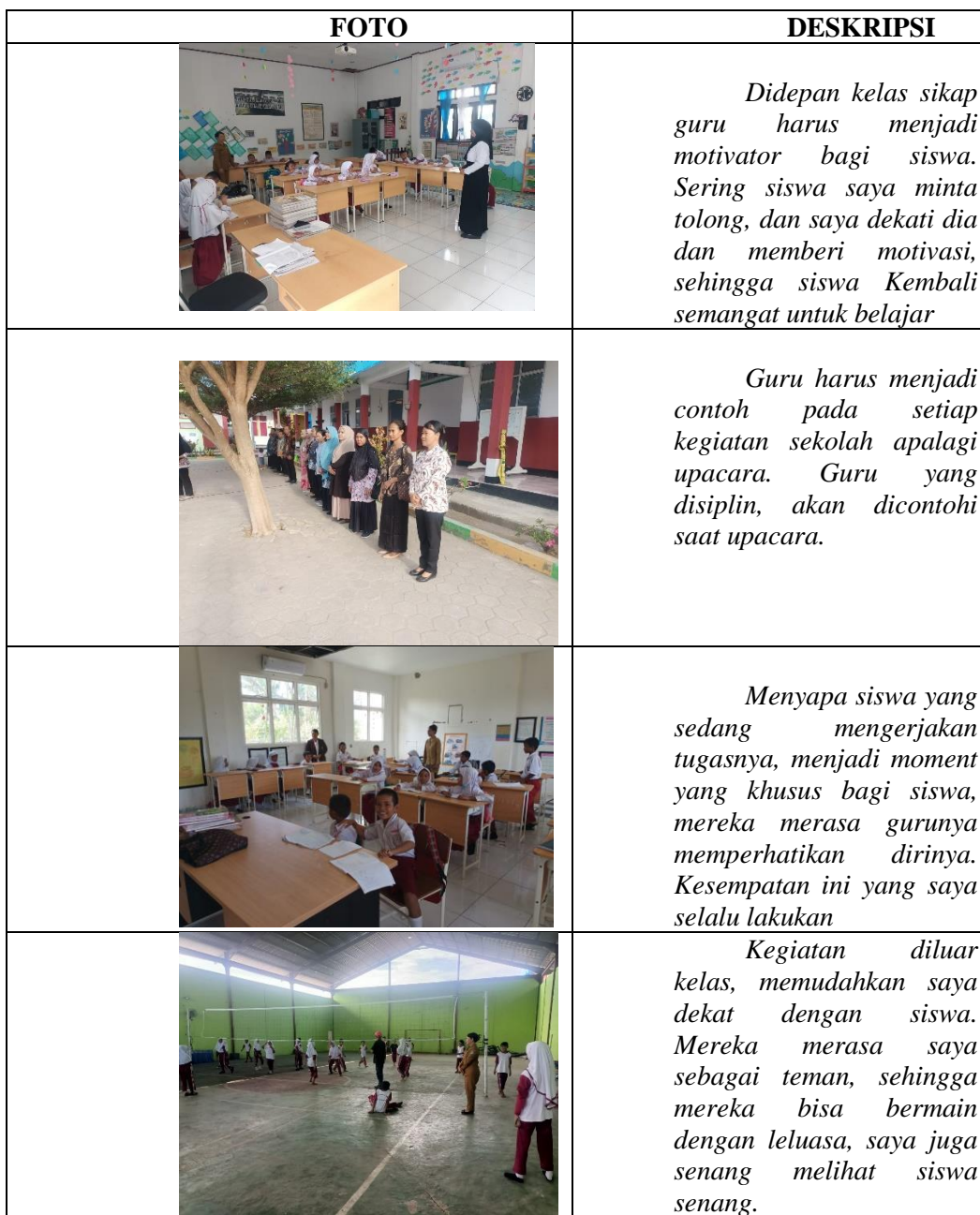
Tabel 2 Lembar Hasil Wawancara Dan Dokumentasi Tentang Peran Guru

3) Faktor-faktor apa saja dari kompetensi dan kepribadian guru yang mempengaruhi karakter siswa?