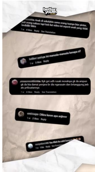
Gambar 7. Visual Effect Kertas