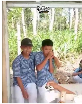
Gambar 2. Video Siswa Cilacap