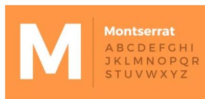
Gambar 6. Font Montserrat (Sumber : https://www.dafontfree.io/montserrat-font-family/ )