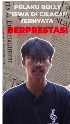
Gambar 4. Visual Effect