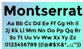
Gambar 5. Font Montserrat

Dalam proyek video narasi ini, digunakan jenis huruf pada font type sans-serif ini sebagai pilihan utama yang sering dipakai oleh Better Youth. Jenis huruf Sans-Serif ini memiliki tingkat keterbacaan yang jelas, dapat memberikan kesan yang sederhana, bersih, dan minimalis. Pada huruf Sans-Serif dapat memberikan kesan yang sesuai dengan konsep yang diusung dalam proyek video ini. Montserrat, merupakan jenis huruf sans-serif geometris yang diciptakan oleh desainer Argentina bernama Julieta Ulanovsky.