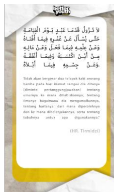
Gambar 3. CTA ( Call To Action )