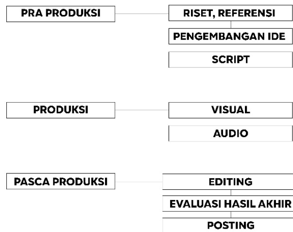
Gambar 1. Tahapan Perancangan Pembuatan Video Narasi BYF Malang

Tahap perancangan merupakan tahap dimana pembuatan mengenai style visual, dan kebutuhan asset atau bahan-bahan untuk perancangan. Pembuatan Video Reels Narasi Better Youth Foundation Malang dilakukan dengan tiga tahap yaitu Pra-Production , Production , dan Pre-Production/Pasca Produksi . Setelah pembuatan video selesai, selanjutnya akan dilakukan evaluasi bersama dengan ketua manajemen media kreatif untuk membuat hasil video narasi menjadi lebih sesuai dengan keinginan perusahaan/Yayasan, dan lebih mencapai hasil target dari Better Youth Foundation sendiri. Tahapan perancangan pembuatan Video Narasi Better Youth Foundation Malang pada gambar 1.