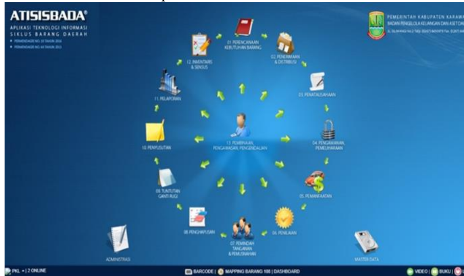
Gambar 4. 2 Aplikasi Atisisbada