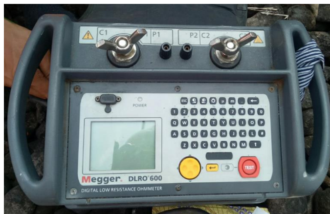
Gambar 2 Alat uji Merk MEGGER DLRO600

Sebelum pengujian dapat dimulai, kontak timah uji potensial dipantau untuk memastikan adanya kontak yang baik. Hal ini mengurangi kemungkinan kesalahan pembacaan dan mencegah lengkung pada titik kontak, yang jika tidak, akan merusak item yang diuji dan kontak lead pengujian. Pengukuran resistansi membutuhkan waktu sekitar 7 detik.