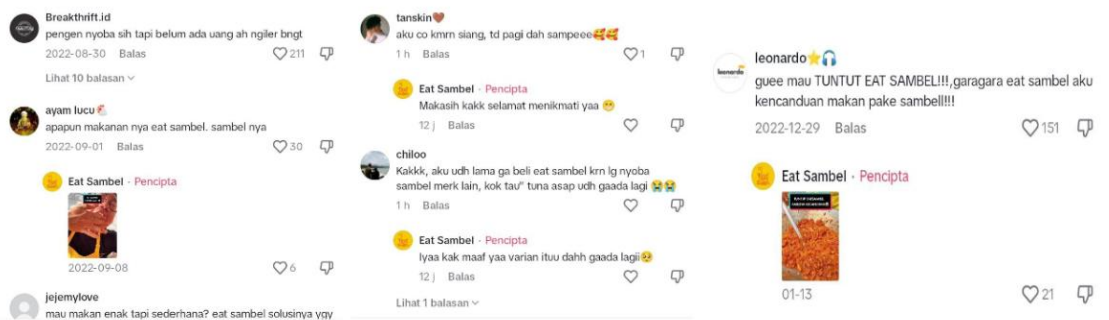
Gambar 8. Respon Pelanggan Pada Kolom Komentar Video Pada Akun Tiktok @eatsambel