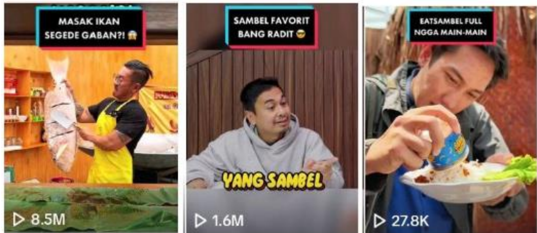
Gambar 8. Jumlah Penonton Pada Akun Tiktok @eatsambel

Berdasarkan jumlah penonton yang tertera pada gambar 8, masing masing video mendapatkan jumlah tontonan lebih dari 10.000 pada setiap videonya.