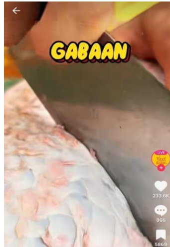
Gambar 3. Penggunaan Kata Kiasan Pada Konten Akun TikTok @eatsambel

Penggunaan kata kiasan juga digunakan dalam konten marketing @eatsambel. Pada gambar 3, Mas Yangun (pemilik akun @eatsambel) melakukan idiolek dalam menjelaskan bahwa ia akan memasak ikan yang sangat besar dan mengucapkan kata “gaben” sebagai kiasan dari kata “besar”. Meskipun kata tersebut tidak terdapat dalam KBBI, namun kata tersebut lebih cocok untuk didengar dalam video dengan konteks promosi yang dilakukan oleh akun @eatsambel.