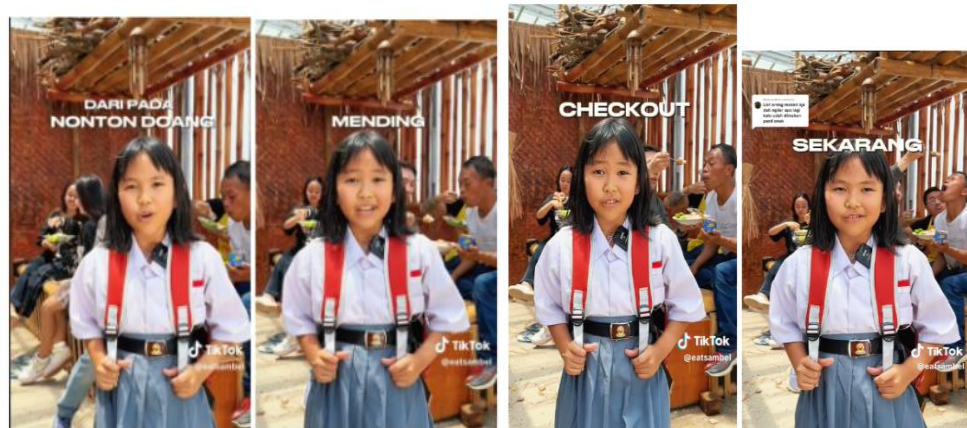
Gambar 7. Penggunaan Teknik Call To Action Pada Konten Akun TikTok @eatsambel

Teknik rima pada cuplikan diatas menggunakan teknik rima akhir ganda, dimana terdapat persamaan bunyi pada dua suku kata akhir. Kata “Sedap” dan “Mantap” pada kalimat “Tuna Asap Sedap Mantap” memiliki persamaan bunyi pada dua suku kata akhirnya. Pemilihan kata pada teknik rima yang digunakan dalam digital marketing produk @eatsambel dapat diingat konsumen bahwa sambal tuna asap milik eatsambel memiliki rasa dan aroma yang sedap dan sangat enak.