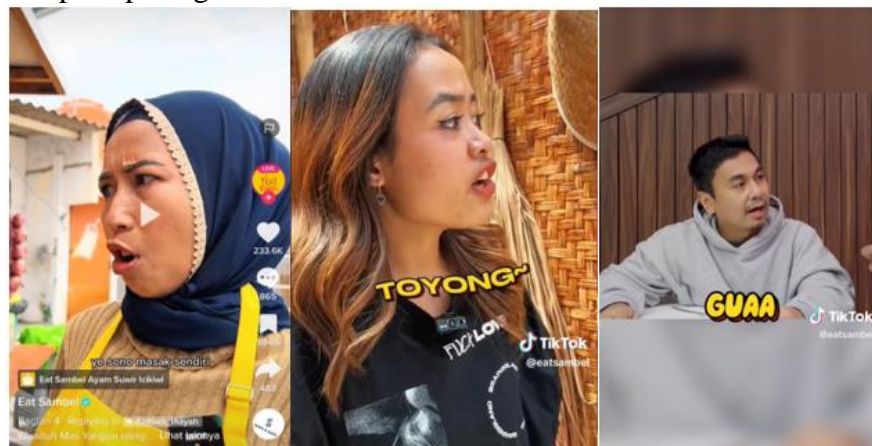
Gambar 2. Penggunaan Bahasa Gaul Pada Konten Akun TikTok @eatsambel

Dari 3 konten diatas, akun @eatsambel lebih banyak menggunakan bahasa gaul yang termasuk ke dalam ragam bahasa santai atau kasual dan kata-kata yang diplesetkan seperti pada gambar dibawah ini.