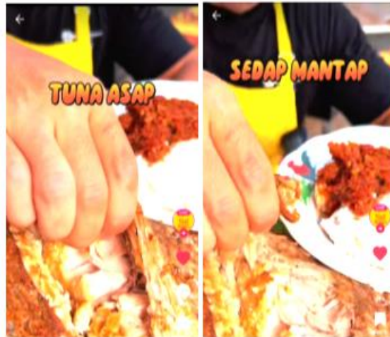
Gambar 6. Penggunaan Teknik Rima Pada Konten Akun TikTok @eatsambel

Teknik rima pada cuplikan diatas menggunakan teknik rima akhir ganda, dimana terdapat persamaan bunyi pada dua suku kata akhir. Kata “Sedap” dan “Mantap” pada kalimat “Tuna Asap Sedap Mantap” memiliki persamaan bunyi pada dua suku kata akhirnya. Pemilihan kata pada teknik rima yang digunakan dalam digital marketing produk @eatsambel dapat diingat konsumen bahwa sambal tuna asap milik eatsambel memiliki rasa dan aroma yang sedap dan sangat enak.