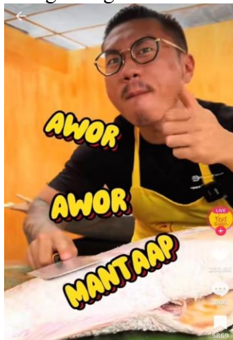
Gambar 5. Penggunaan Slogan Pada Konten Akun TikTok @eatsambel

Akun TikTok @eatsambel menggunakan slogan pada kontennya, sebagai salah satu strategi dalam memasarkan dan membangun citra merek pada pasar. Dalam konteks pemasaran, Kotler (2007) menjelaskan bahwasannya merek adalah suatu nama, istilah, tanda, simbol, yang digunakan untuk mendefinisikan barang ataupun jasa yang disediakan dengan tujuan sebagai pembanding dengan pesaing. Untuk mempermudah konsumen mengingat suatu merek pada ingatan mereka, slogan dapat membantu meningkatkan citra merek dan mengubah persepsi konsumen melalui slogan. Sehingga, konsumen akan mengingat suatu brand ketika mendengar slogan mereka. Pada akun TikTok @eatsambel mereka menggunakan kalimat “Awor Awor Mantap” sebagai slogan mereka.