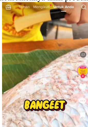
Gambar 4. Penggunaan Tambahan Abjad Pada Konten Akun TikTok @eatsambel

Penambahan abjad pada sulih teks dalam konten video juga banyak dilakukan di konten akun TikTok @eatsambel, seperti pada gambar dibawah ini dari konten 1 dan 2 memiliki tambahan abjad disetiap sulih teksnya. Penambahan abjad digunakan untuk memberi makna lebih pada produknya, hal ini dapat digunakan untuk meyakinkan konsumennya akan produk yang mereka miliki.