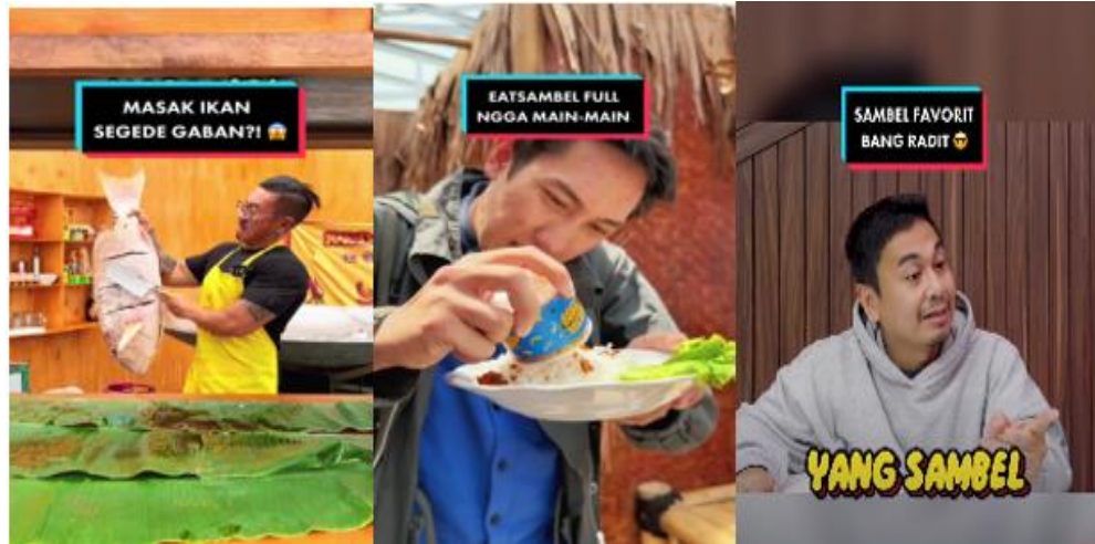
Gambar 1. Konten TikTok Akun @eatsambel

mengambil 3 video konten sebagai tolak ukur dari ragam bahasa dalam digital marketing akun @eatsambel.