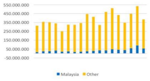
Gambar 2 Perkembangan nilai RCA kopi Indonesia di pasar Malaysia

Walaupun permintaan pasar Malaysia atas Indonesia untuk komoditi kopi cenderung fluktuatif, namun ekspor Indonesia untuk komoditi kopinya menunjukkan tren yang positif secara umum pada jangka panjang. Ekspor komoditi kopi Indonesia ke Malaysia.