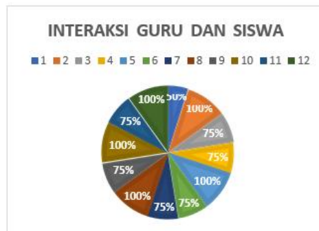
Gambar 4.1 Bagan Interaksi Guru dan Siswa

Hasil kuesioner respon siswa yang diberikan kepada siswa kelas IV menunjukkan bahwa seluruh siswa setuju mengikuti kegiatan pembelajaran daring. Dari delapan butir pernyataan pada kuesioner yang diberikan peneliti, pada butir pertama seluruh siswa menjawab dengan rata-rata 1 yang menunjukkan persentase 100%, yang artinya selama masa pandemi berlangsung siswa setuju menerapkan pembelajaran daring. Pada butir kedua rata-rata yang menjawab ya sebanyak 0,729 yang menunjukkan persentase 72,9 % siswa setuju jika pembelajaran daring menggunakan aplikasi zoom meeting. Pada butir ketiga rata-rata 0,594 menunjukkan persentase 59,4% siswa yang bisa menggunakan aplikasi zoom meeting. Pada butir keempat rata-rata 0,756 menunjukkan persentase 75,6% siswa yang selama pembelajaran daring menggunakan aplikasi zoom meeting yang masih dibantu oleh orang tua. Pada butir kelima rata-rata 0,297 menunjukkan persentase 29,7% siswa yang masih mengalami kesulitan saat menggunakan aplikasi zoom meeting. Pada butir keenam rata-rata 0,81 menunjukkan 81% siswa yang menjawab bahwa materi yang di sampaikan guru pada pembelajaran dari melalui zoom meeting sudah tersampaikan dengan baik. Pada butir ketujuh rata-rata 0,783 menunjukkan persentase 78,3% siswa yang menjawab bahwa pembelajaran daring melalui zoom meeting menyenangkan. Pada butir kedelapan rata-ratanya 0,756 menunjukkan persentase 75,6% siswa yang setuju jika selama masa pandemic ini menggunakan aplikasi zoom meeting.