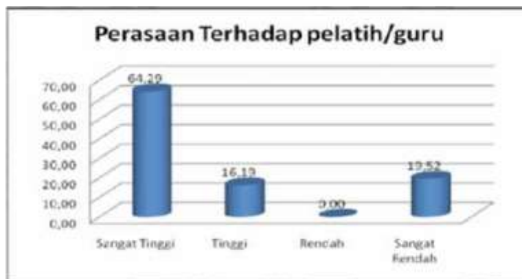
Gambar 5. Faktor Perasaan Terhadap Pelatih/Guru