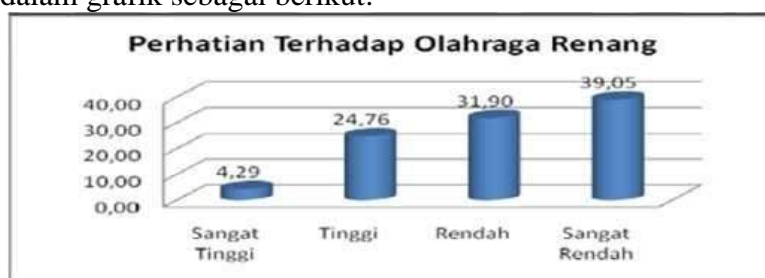
Gambar 6. . Faktor Perhatian Terhadap Olahraga Renang

Berdasarkan tabel 4.6. diatas terlihat bahwa minat olahraga renang siswa kelas X SMA 1 TELUK JAMBE TIMUR berdasarkan faktor perhatian terhadap Olahraga renang sebanyak 82 siswa atau 39,05% termasuk dalam kategori sangat rendah, sebanyak 67 siswa atau 31,90% termasuk dalam kategori rendah, sebanyak 52 siswa atau 24,76% termasuk dalam kategori tinggi dan 9 siswa atau 4,29% kategori sangat tinggi. Dengan demikian secara umum dapat dijelaskan bahwa perhatian terhadap olahraga renang pada siswa kelas X SMA 1 TELUK JAMBE TIMUR pada dasarnya sangat rendah. untuk lebih jelasnya dapat diilustrasikan dalam grafik sebagai berikut: