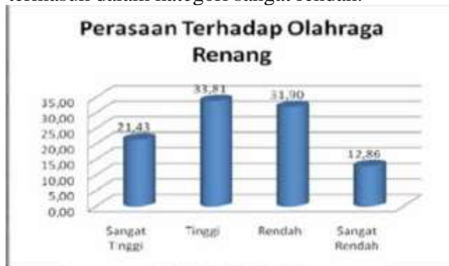
Gambar 4. Faktor Perasaan Terhadap Olahraga Renang

Berdasarkan tabel 4.4. diatas terlihat bahwa minat olahraga renang siswa kelas X SMA 1 TELUK JAMBE TIMUR berdasarkan faktor perasaan terhadap Olahraga renang, terlihat sebanyak 71 siswa atau 33,81% termasuk dalam kategori tinggi, sebanyak 67 siswa atau 31,90% termasuk dalam kategori rendah, sebanyak 45 siswa atau 21,43% termasuk dalam kategori sangat tinggi dan 27 siswa atau 12,86% termasuk dalam kategori sangat rendah.