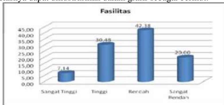
Gambar 8. Faktor Fasilitas

Berdasarkan tabel 4.9 diatas terlihat bahwa minat siswa terhadap olahraga renang pada siswa kelas X SMA 1 TELUK JAMBE TIMUR berdasarkan faktor fasilitas terlihat sebanyak 89 siswa atau 42,38% termasuk dalam kategori tinggi, sebanyak 64 siswa atau 30,48% termasuk dalam kategori tinggi, sebanyak 42 siswa atau 20% termasuk dalam kategori sangat rendah dan 15 siswa atau 7,14% kategori sangat tinggi. Dengan demikian secara umum dapat dijelaskan bahwa minat siswa terhadap olahraga renang siswa kelas X SMA 1 TELUK JAMBE TIMUR berdasarkan faktor fasilitas pada dasarnya rendah. Untuk lebih jelasnya dapat diilustrasikan dalam grafir sebagai berikut: