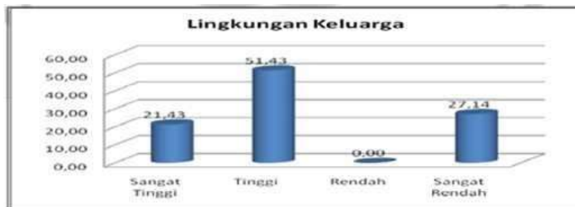
Tabel 9. Faktor Fasilitas