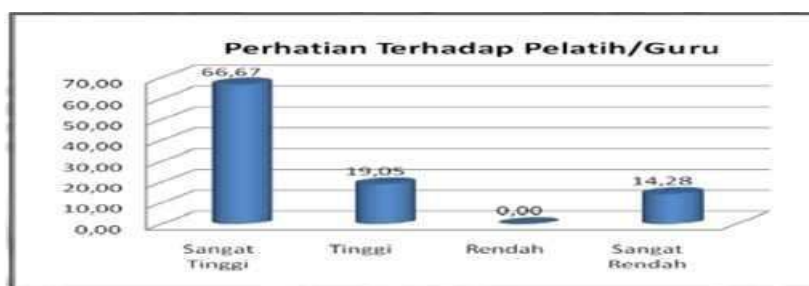
Gambar 4.6 Faktor Perhatian Terhadap Pelatih/guru

Berdasarkan tabel 7. di atas terlihat bahwa minat olahraga renang siswa kelas X SMA 1 TELUK JAMBE TIMUR berdasarkan faktor perhatian terhadap pelatih/ sebanyak 140 siswa atau 66,67% termasuk dalam kategori sangat tinggi, sebanyak 40 siswa atau 19,05% termasuk dalam kategori tinggi, sebanyak 30 siswa atau 14,28% termasuk dalam kategori sangat rendah dan tidak ada dalam kategori rendah. Dengan demikian secara umum dapat dijelaskan bahwa perhatian terhadap pelatih/guru pada siswa kelas X SMA 1 TELUK JAMBE TIMUR pada dasarnya sangat tinggi. Untuk lebih jelasnya dapat diilustrasikan dalam grafik sebagai berikut: