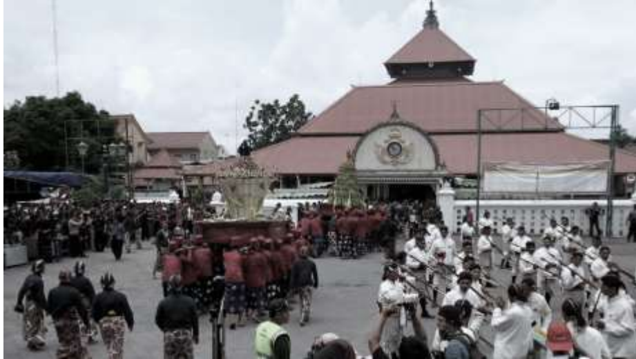
Gambar 3. Tradisi Gerobogan di DIY. Mengenal Grebeg Syawal, Tradisi Keraton Yogyakarta di Hari Lebaran . Hak Cipta 2019, Oleh PANRB.

Pentingnya wisata budaya untuk menjaga tradisi dan adat istiadat yaitu untuk memperkenalkan budaya dan menghormati leluhur. Selain itu, upacara atau adat istiadat ditampilkan untuk meningkatkan kualitas populasi turis di kawasan itu, memungkinkan kunjungan sepanjang tahun, melindungi warisan budaya, dan mendorong pembangunan ekonomi dan sosial budaya. DIY memiliki destinasi wisata yang menarik. Bagi masyarakat dari berbagai macam suku dan daerah. Upacara tradisi Grebeg menjadi tradisi yang hadir pada hari hari besar keagamaan islam, seperti halnya adalah hari raya maulid yang dilaksanakan pada pagi hari yang bertempat di Keraton Yogyakarta. Arti, nilai, dan fungsi Grebeg dapat menjadi pedoman dan wawasan dalam berkehidupan. Implementasi pariwisata budaya di DIY melalui tradisi grebeg bertujuan untuk meningkatkan minat dan daya tarik wisatawan seperti halnya pada pertunjukkan tari, gamelan, dan arak-arakan Tumber Sanga. Hal ini dikarenakan pada tradisi grebeg menampilkan berbagai simbol ekspresif seperti halnya seni rupa, musik dan tari, serta menjunjung kesatuan bangsa dan nilai-nilai religi berupa penyampaian Syiar Islam sebagaimana aturan dan norma yang tertuang di masyarakat.