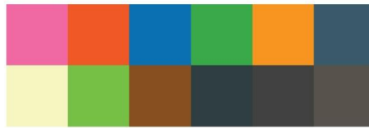
Gambar 1. Penggunaan Warna

digunakan pada suatu desain juga memberikan karakter dan makna yang berbeda sesuai dengan topik atau isi yang dibawakan dalam buku. Pada perancangan ini, penulis menggunakan kombinasi warna hangat dan dingin. Secara psikologi, warna hangat memiliki karakter gembira, optimis, kuat, dan kreatif. Sedangkan warna dingin memiliki karakter yang damai, tenang, dan rileks. Menurut Hidayat (2022), warna panas adalah warna yang di dalamnya mengandung unsur merah dan kuning. Warna dingin adalah warna yang di dalamnya mengandung unsur biru, hijau, dan ungu.