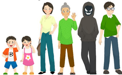
Gambar 3. Desain Karakter Terpilih

Dari beberapa alternatif desain karakter yang sudah dibuat dilakukan kuesioner dan diperoleh karakter terpilih berdasarkan validasi dari target audiens.