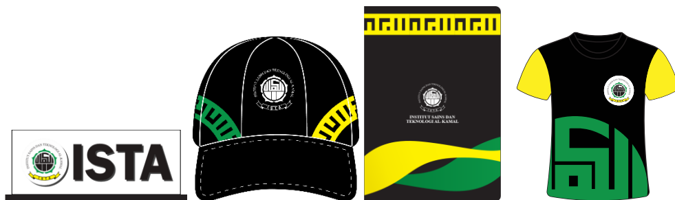
Figure 11. Miniatur signage, topi, notebook, kaos