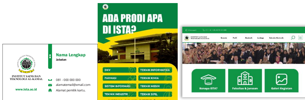
Figure 9. Kartu nama, post instagram, website