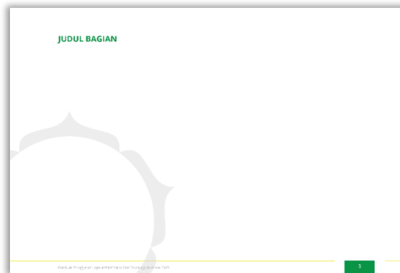
Figure 3. Layout Halaman

kiri ke kanan. Margin posisi kiri dan kanan sebesar 25 mm. Margin posisi atas dan bawah sebesar 20 mm. Setiap halaman menggunakan grid 6 x 6. Cover berisi logo negatif, judul, dan supergraphic. Bagian pembatas bab berisi nomor bab, judul bab, dan elemen grafis hijau. Pembatas bab hanya berada di halaman ganjil. Bagian konten berisi tentang judul konten, nomor halaman, dan supergraphic.