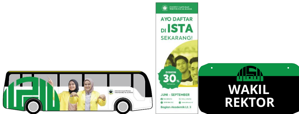
Figure 10. Miniatur bus, xbanner, papan nama ruangan