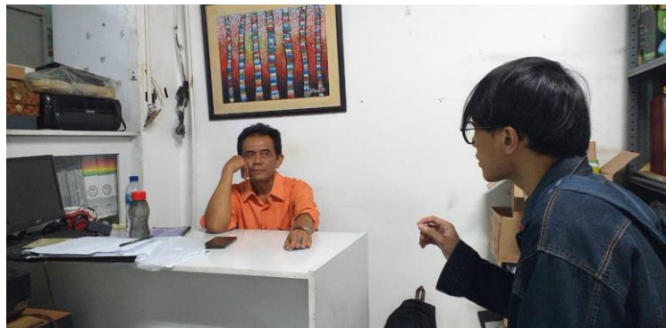
Figure 1. Proses Wawancara

Metodologi penelitian yang digunakan adalah metodologi penelitian kualitatif. Metode yang digunakan untuk mengumpulkan data adalah observasi, kepustakaan dan wawancara. Observasi dilakukan dengan mendokumentasikan penerapan logo institusi di berbagai platform seperti situs resmi institusi, kop surat, xbanner, bendera mimbar, kaca, kertas ujian dan lainnya.