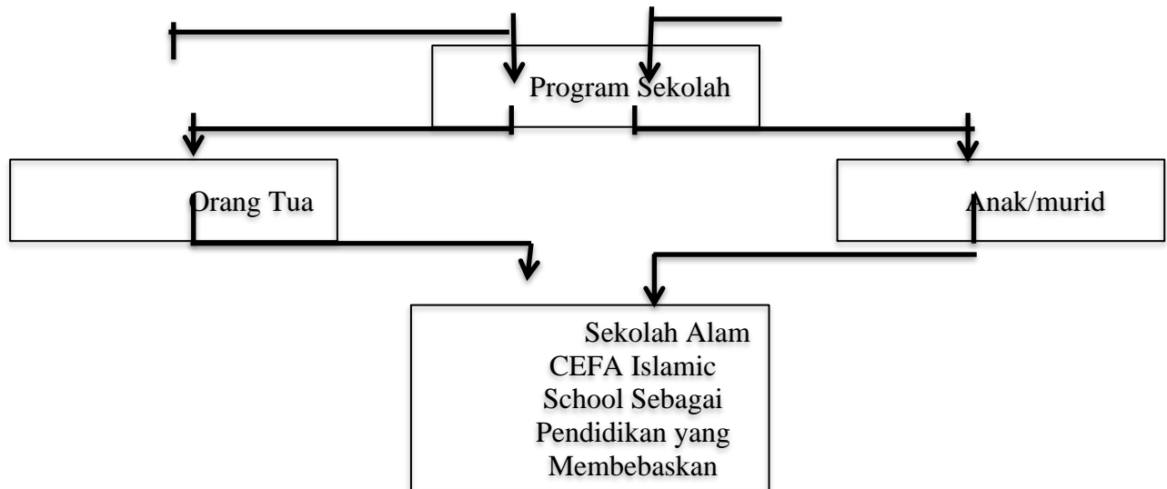
Gambar 2.4 Bagan Kerangka Berpikir