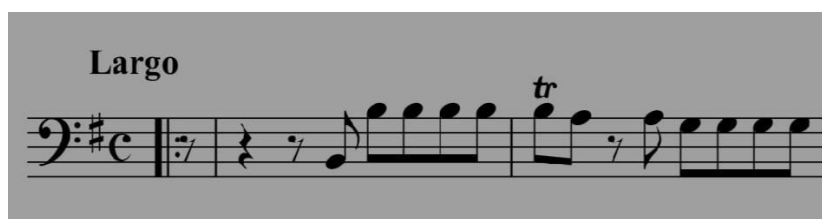
Gambar 2. Gambar teknik trill

Pada bar 2 terdapat penggunaan teknik trill yang dalam cello merupakan teknik yang melibatkan pergantian cepat antara dua nada yang berdekatan, biasanya satu nada dasar dan nada yang lebih tinggi. Teknik ini dilakukan dengan cepat mengganti jari yang menekan senar, sehingga menciptakan efek melodi yang bergetar dan ekspresif.