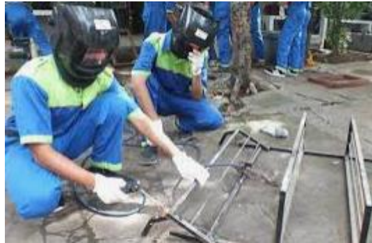
Gambar 2. Praktek kewirausahaan

Hasil pembelajaran kewirausahaan di kelas perlu di tingkatkan, dengan meningkatkan minat baca dan praktek. Praktek yang padat dan berjenjang akan membuat anak menjadi memahami proses suatu produk manufaktur (Purba,dkk. 2022).