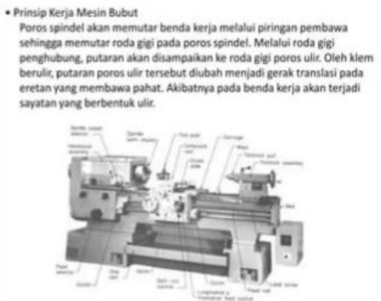
Gambar 1. Teks Prosedur Kompleks

Sistem pembelajaran seperti demikian sudah mulai ditinggalkan, namun belum sepenuhnya. Guru masih mengambil peran yang dominan di kelas. Walaupun sudah terjadi dialog-dialog yang menunjukkan adanya demokratisasi dibidang pendidikan (Nuriyanti.dkk. 2023) Untuk lebih mengoptimalkan sistem pembelajaran itu maka peran guru hendaknya sebatas motivator dan fasilitator bagi pemecahan masalah-masalah yang dihadapi murid-muridnya, apabila ada permasalahan yang tidak terselesaikan di kelas, maka guru harus mengarahkan mereka ke perpustakaan atau sumber informasi lainnya.