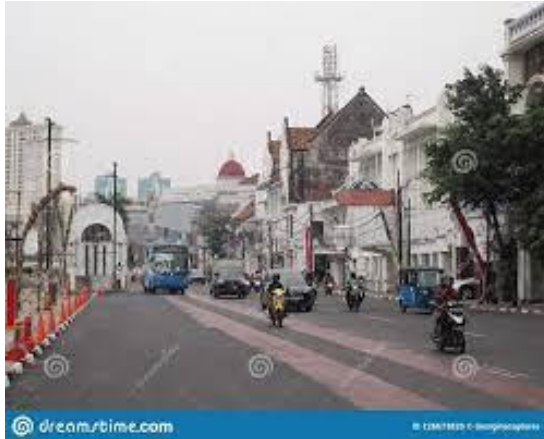
Gambar 8. Jalan Arteri Kota Tua

Sebagai Kawasan bersejarah di Jakarta, tidak heran jika banyak landmark yang berada di sekitar Kawasan Kota Tua ini. Dan yang menjadi ikonik yang ada di Kawasan Kota Tua tersebut ialah Museum Sejarah Jakarta atau yang sering dikenal dengan Museum Fatahillah dan Café Batavia yang sebagai primadona bagi wisatawan yang ingin merasakan sentuhan arsitektur Neo-Klasik.