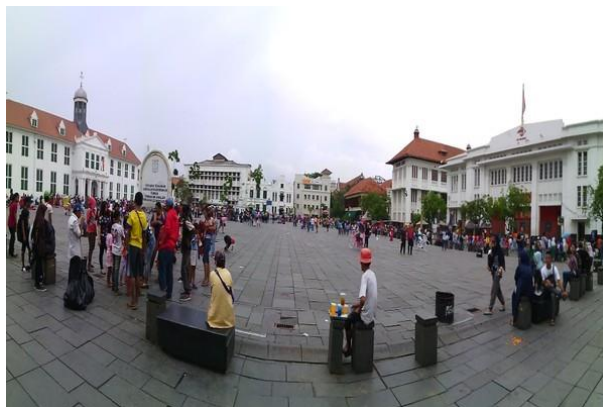
Gambar 7. Open Space Antara Bangunan

Dari diagram itu juga bisa diidentifikasi bahwa Kota Tua menggunakan pola grid yang teratur untuk menyusun tata ruang perkotaan.