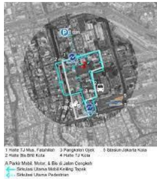
Gambar 11. Diagram Lokasi Signage

petunjuk jalan, Kota Tua juga sudah mempunyai petunjuk dimana pengunjung harus menunggu moda transportasi umum.