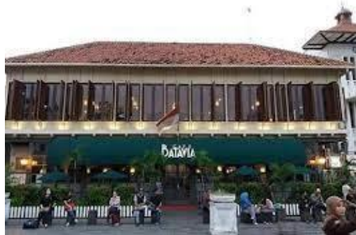
Gambar 9. Café Batavia

Sebagai Kawasan bersejarah di Jakarta, tidak heran jika banyak landmark yang berada di sekitar Kawasan Kota Tua ini. Dan yang menjadi ikonik yang ada di Kawasan Kota Tua tersebut ialah Museum Sejarah Jakarta atau yang sering dikenal dengan Museum Fatahillah dan Café Batavia yang sebagai primadona bagi wisatawan yang ingin merasakan sentuhan arsitektur Neo-Klasik.