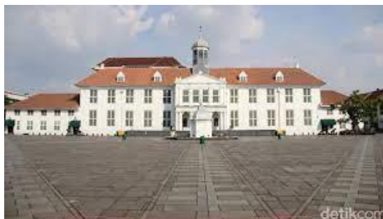
Gambar 10. Museum Fatahillah