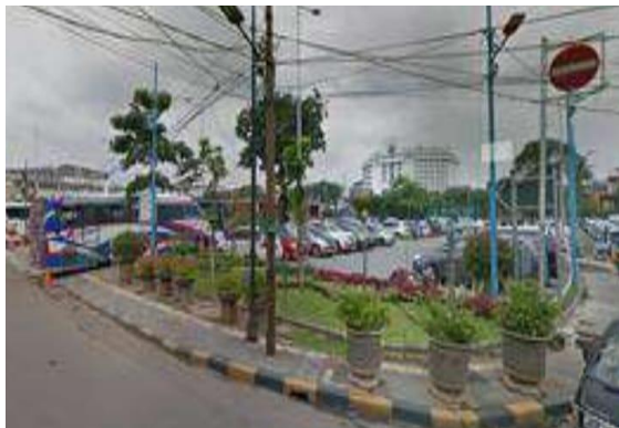
Gambar 3. Stasiun Jakarta Kota Tua