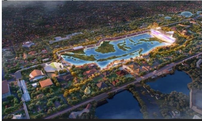
Gambar 1. Revitalisasi TMII

serba guna Sasono Utomo, Langen Budoyo, dan Sasono Adiguno dengan total luas bangunan 59.907 m 2 . Proyek penataan dan renovasi area di TMII ditargetkan dapat diselesaikan pada akhir tahun 2022 dengan masa pemeliharaan selama 180 hari kalender. Taman Mini Indonesia Indah (TMII) ini berlokasi di Kelurahan Ceger, kecamatan Cipayang, Jakarta Timur, provinsi DKI Jakarta.