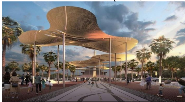
Gambar 2. Revitalisasi TMII