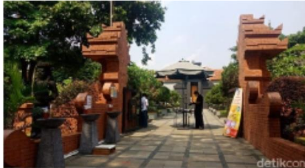
Gambar 4. Wahana rekreasi di TMII

Pengembangan pariwisata di TMII memiliki berbagai potensi yang perlu dikembangkan dengan tujuan untuk meningkatkan kesejahteraan masyarakat. Berdasarkan teori pariwisata oleh Suryadana (2015) dalam mengembangkan pariwisata di Kabupaten Wonosobo dapat dilihat melalui komponen berikut :