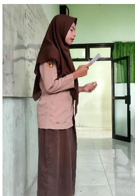
Gambar 1. Siswa membacakan hasil karya puisi

Berdasarkan pemaparan di atas dapat diketahui bahwa dari pihak sekolah telah mempersiapkan kegiatan literasi tersebut dengan matang, dimana menambahkan kegiatan literasi pada jam khusus agar mampu meningkatkan kemampuan membaca dan berpikirnya.