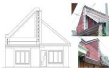
Gambar 6. Bentuk Atap Gevel – Pelana Terbelah Rumah Tinggal Kolonial di Kauman

6. Atap gevel – pelana terbelah Atap ini menggunakan bentuk dasar atap perisai, dengan permainan ketinggian satu sisi atap. Bentuk atap ini terlihat tidak simetris, dengan satu bidang atap yang lebih tinggi dari bidang atap yang lain, dan tidak terdapat bubungan, melainkan dinding masif. Bentuk atap ini mirip dengan bentuk atap jengki, namun atap jengki terbentuk dari luasan bidang ruang yang tidak simetris, sehingga bidang atap memiliki luasan yang tidak sama. Pada bentuk atap pelana terbelah ini, bentuk atap asimetris terwujud karena satu sisi atap lebih tinggi dari sisi yang lain. Satu sisi atap yang lebih tinggi berdiri di atas gevel menerus dari permukaan tanah. Perbedaan ketinggian sisi atap ini menyebabkan terdapat dinding masif pada garis bubungan atau garis tengah atap. Penggunaan bentuk atap ini terdapat pada satu sampel rumah tinggal kolonial di Kauman (Gambar 6.)