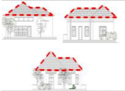
Gambar 4.2. Bentuk Atap Perisai Ganda Rumah Tinggal Kolonial di Kauman

rumah yang bukan bentukan tunggal, atau bentuk pola rumah dengan adanya substitusi geometris di beberapa bagiannya. Atap perisai ganda pada fasade bangunan terlihat dengan paduan bentuk segitiga dan trapesium. Atap perisai ganda ditemukan pada 3 sampel rumah tinggal kolonial di Kauman, yakni pada gambar berikut (Gambar 2.).