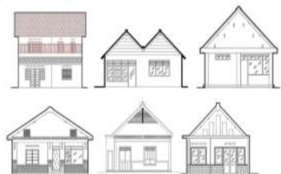
Gambar 4.5. Bentuk Atap Pelana Rumah Tinggal Kolonial di Kauman

Bentuk atap pelana sering disebut sebagai bentuk yang sederhana. Bentuk atap pelana tersusun atas dua sisi bidang atap yang bertemu pada satu garis atau disebut bubungan. Sudut kemiringan atap pelana pada bangunan umumnya antara 30 – 45°. Pada rumah tinggal di Kauman, terdapat 6 bangunan sampel dengan penggunaan atap pelana (Gambar 5.).