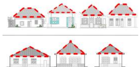
Gambar 1. Bentuk Atap Perisai Rumah Tinggal Kolonial di

Bentuk atap perisai atau sering disebut atap limas tersusun atas 4 bidang atap, dengan dua bidang atap yang bertemu pada satu garis bubungan jurai, dan dua bidang atap bertemu pada garis bubungan atas. Pada fasade bangunan, atap perisai dapat terlihat dengan bentuk trapesium, dan bentuk segitiga. Pada bangunan rumah tinggal kolonial di Kauman, terdapat 7 bangunan sampel dengan penggunaan atap perisai.