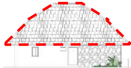
Gambar 4. Bentuk Atap Perisai Bersusun Rumah Tinggal Kolonial di Kauman

Atap perisai bersusun memiliki bentuk dasar atap perisai yang seolah – olah memiliki dua tingkat. Atap ini disebut juga atap mansard dan banyak digunakan pada masa pemerintah Belanda menduduki Indonesia. Penggunaan bentuk atap perisai bersusun dapat ditemukan pada satu sampel rumah tinggal kolonial di Kauman (Gambar .4.)