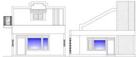
Gambar 4.7. Bentuk Gevel Rumah Tinggal Kolonial di Kauman

Gevel merupakan dinding menerus yang digunakan sebagai pendukung penutup atap. Gevel hanya digunakan sebagai penutup fasade bangunan, yang seringkali dibalik gevel terdapat atap bangunan yang sebenarnya. Gevel pada fasade berfungsi sebagai kepala bangunan. Gevel berbentuk geometris, dengan bentuk kotak, segitiga, ataupun perpaduan keduanya. Penggunaan gevel terdapat pada dua sampel bangunan rumah tinggal kolonial di Kauman dengan variasi yang berbeda (Gambar 4.7.).