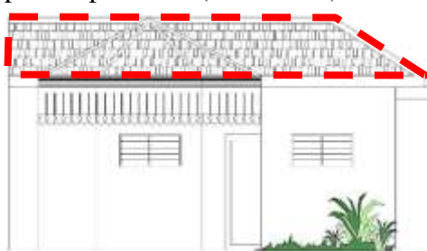
Gambar 3. Bentuk Atap Perisai Piramida Rumah Tinggal Kolonial di Kauman

Bentuk atap perisai piramida merupakan perpaduan bentuk atap perisai yang dipadukan dengan bentuk atap piramida. Atap piramida berbentuk prisma tegak dengan satu buah titik puncak, dan terbentuk oleh denah bangunan lebih dari segi empat. Jumlah bidang atap mengikuti jumlah bidang dinding ruang, yang memusat pada titik puncak. Atap perisai piramida terbentuk oleh perpaduan bidang atap segi banyak yang memusat pada satu titik puncak dan bergabung dengan bubungan bidang atap perisai. Pada rumah tinggal kolonial di Kauman terdapat satu buah sampel yang menggunakan bentuk atap perisai piramida (Gambar 3.)